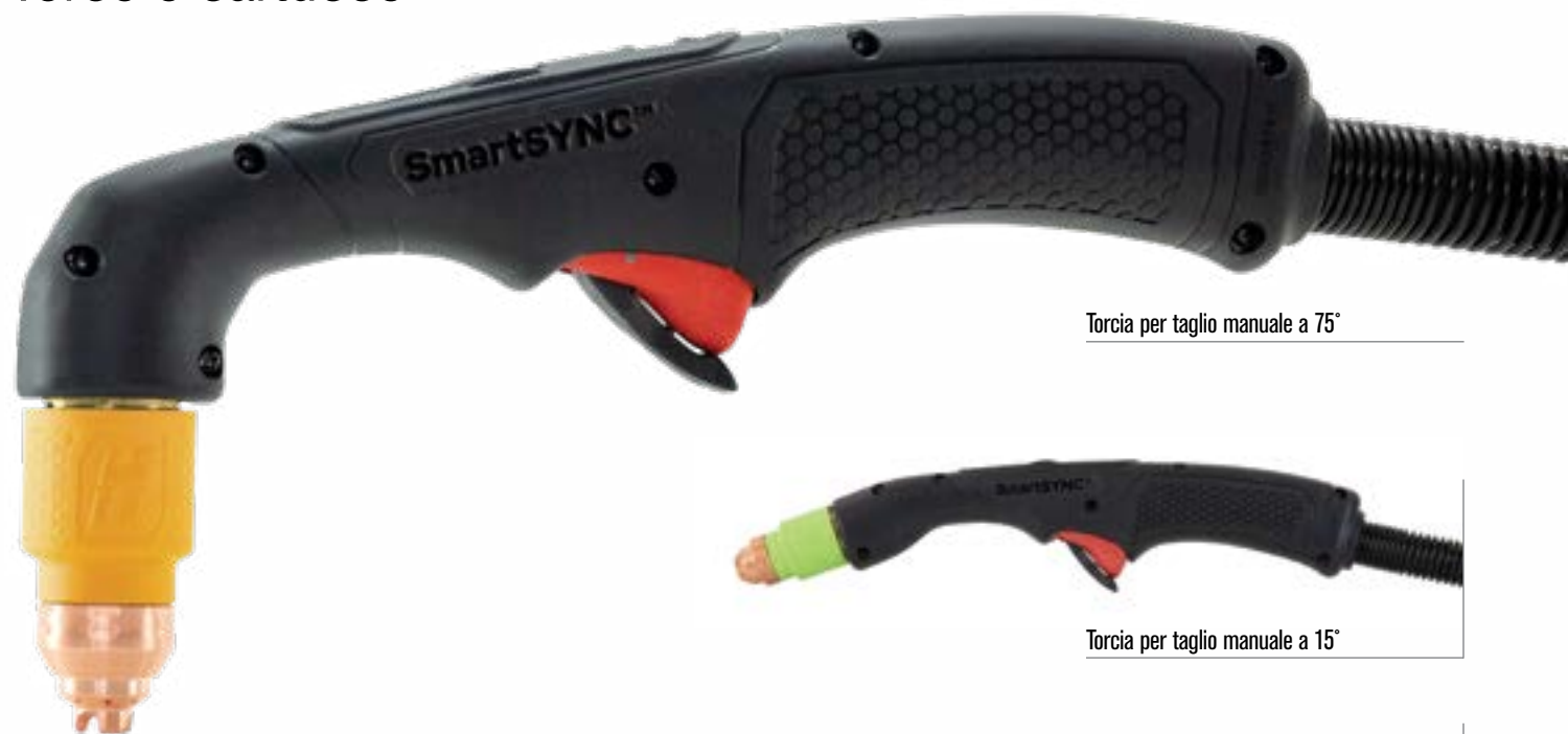
Torcia per taglio manuale a 75°