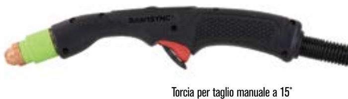
Torcia per taglio manuale a 15°