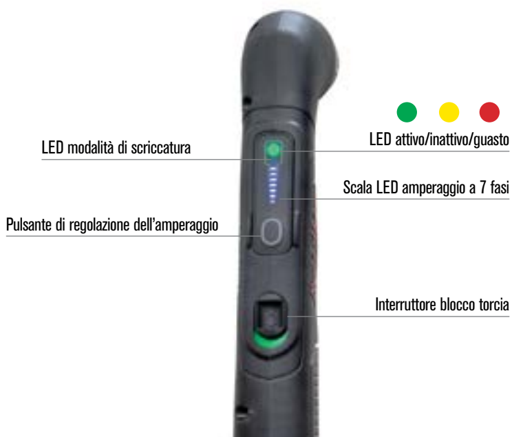
LED modalità di scricatura